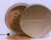
Amazing Base SPF20, Jane Iredale

Διπλά διορθωτικά κραγιόν, διαθέτουν λεπτή μύτη που διαμορφώνει φυσικό περίγραμμα και εμποδίζει το κραγιόν να «τρέξει», και φαρδιά μύτη, για φυσικό χρώμα στα χείλη. Σε δύο αποχρώσεις.