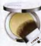
Redness Solutions Instant Relief Mineral Pressed Powder, Clinique

Βάση, κονσίλερ, πούδρα και αντιλιακό 4 σε 1 σε ελεύθερη μορφή, από αγνά ορυκτά μέταλλα. Μειώνει την εμφάνιση πόρων και ρυτίδων και παρέχει μεγάλη κάλυψη. Σε 16 αποχρώσεις (Σε επλεγμένα ισοτιπία αισθητικής, τηλ. 210-9329800).