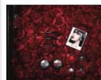
Sephora μου, Sephora μου!