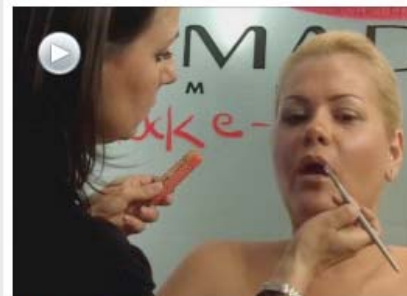
Video: Juicy Lips